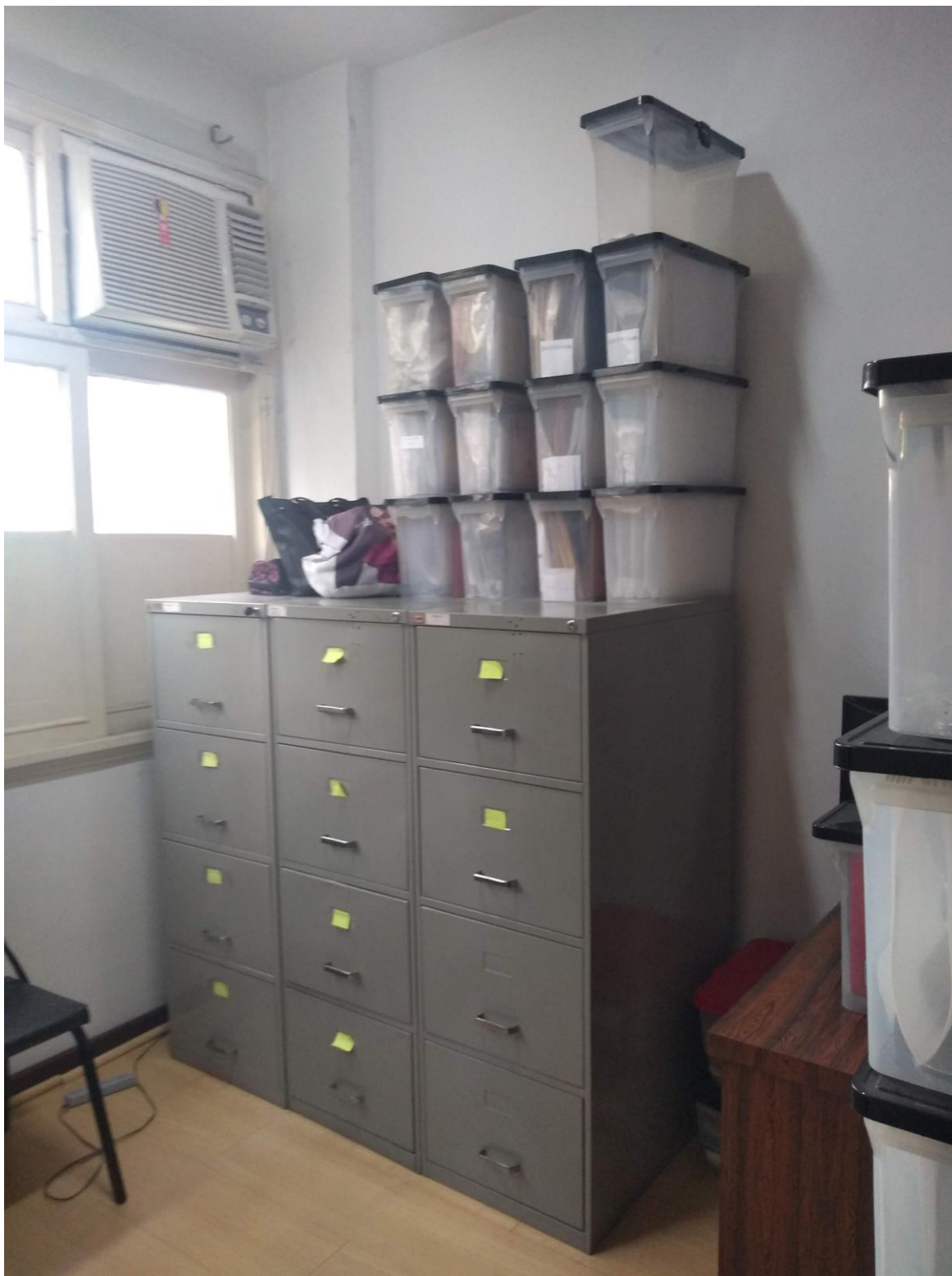
ORGANIZAÇÃO DOS DOCUMENTOS NO ARQUIVO DE AÇO E EM CAIXAS DE PASTA SUSPensa