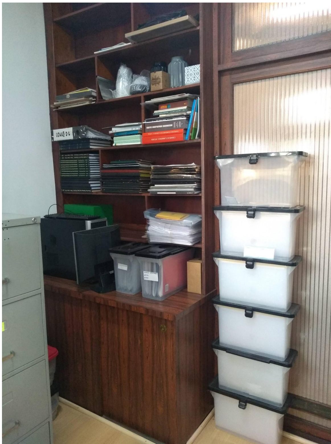
ORGANIZAÇÃO DOS DOCUMENTOS EM CAIXAS DE PASTA SUSPENSAS