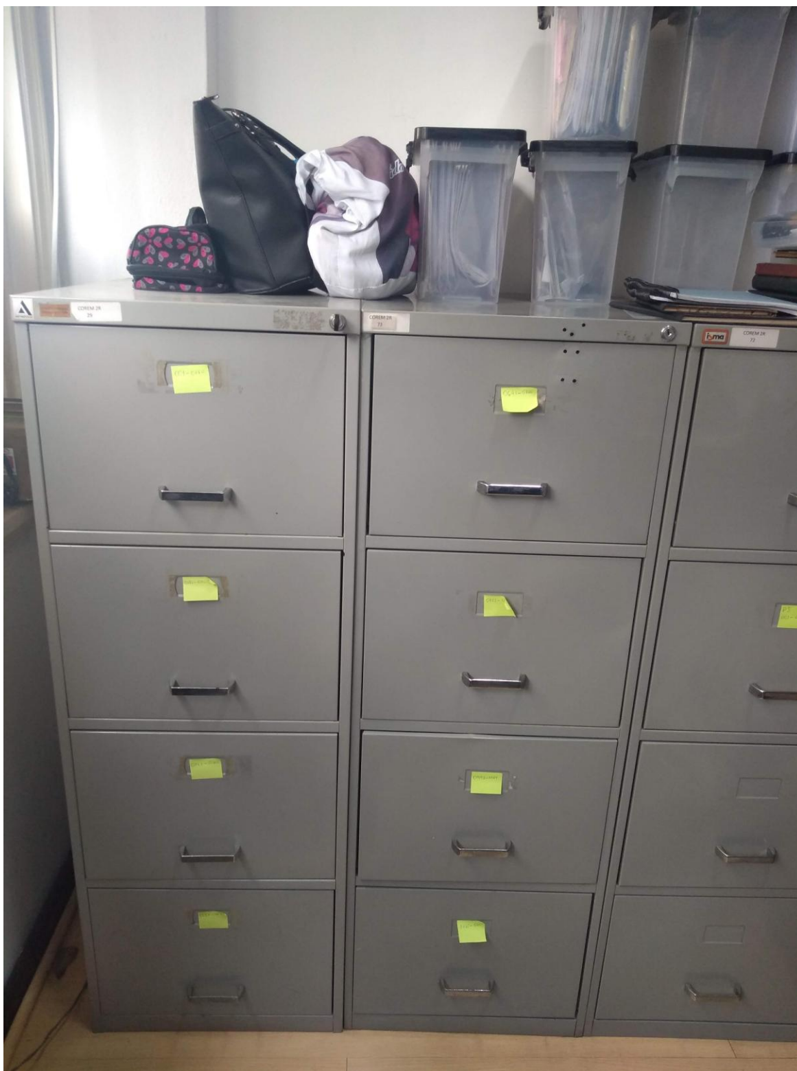
ARQUIVO DE AÇO DE GUARDA DOS DOCUMENTOS