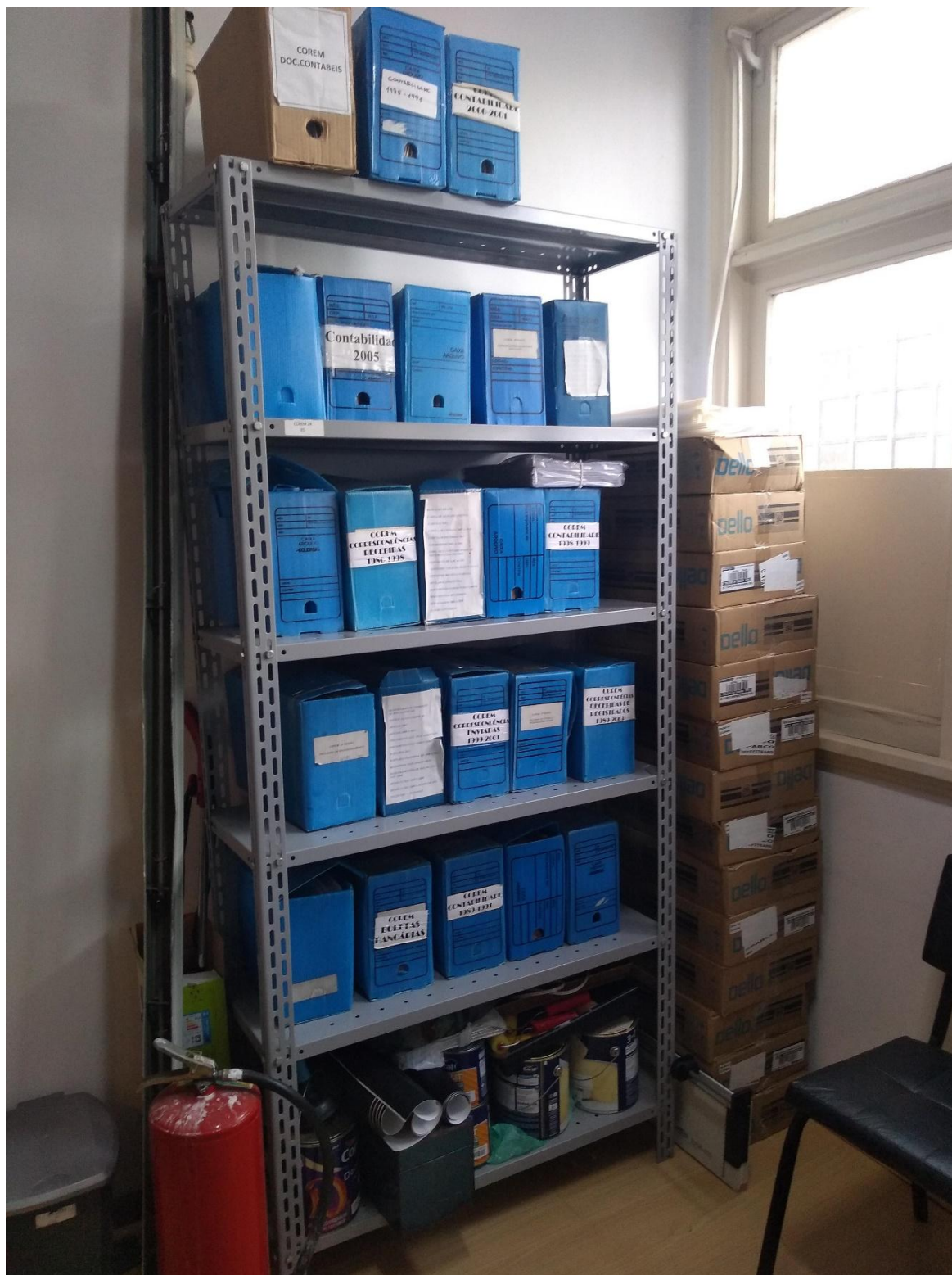
ESTANTE DE AÇO COM CAIXAS LACRADAS CONTENDO DOCUMENTOS